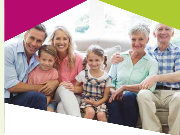
Mars 2018 - Conception graphique : esens-creation.fr - Imprimerie Castay